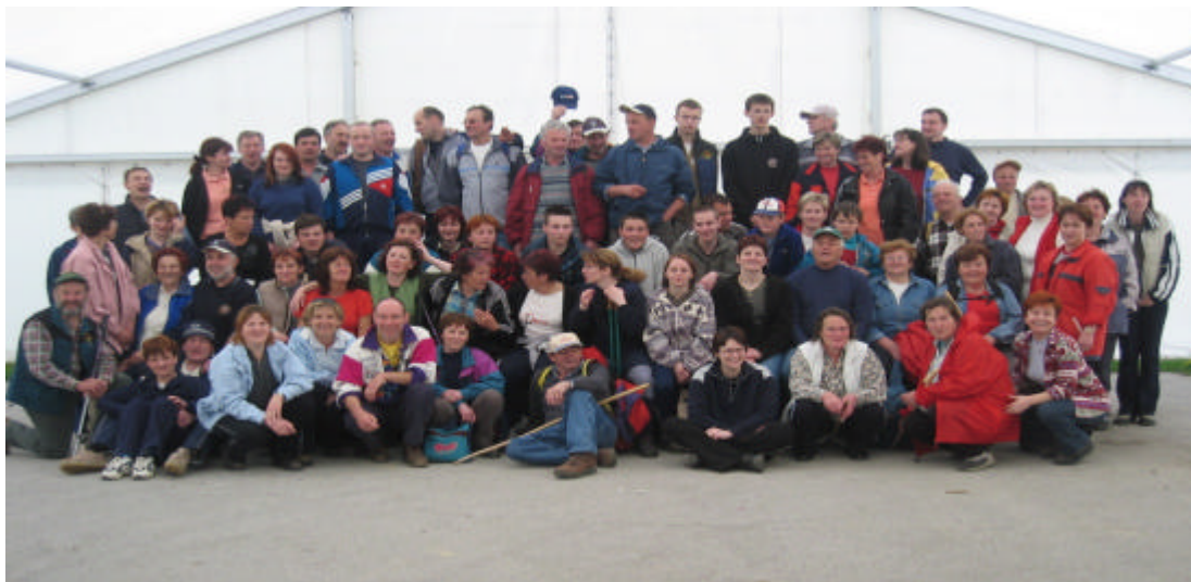
Dve skupini udeležencev pohoda