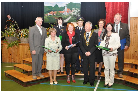
prejemniki občinskih priznanj