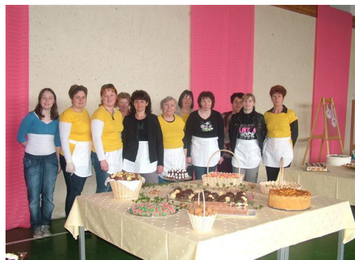
Društvo žena in deklet