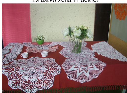
razstava ročnih del