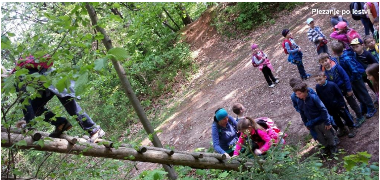
Plezanje po lestvi.