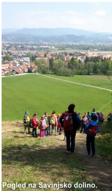
Pogled na Savinjsko dolino.