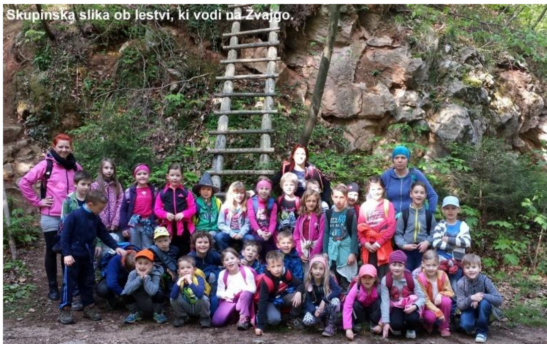
Skupinska slika ob lestvi, ki vodi na Žvajgo.

24. 4. 2017 smo se z učenci 1. in 2. razreda OŠ Vransko - Tabor, POŠ Tabor, odpravili na hrib Žvajga, 626 m. Kombi nas je iz POŠ Tabor odpeljal do Gaja v Preboldu, od koder smo se odpravili proti vrhu. Vrh smo osvajali po markirani poti najprej po trim stezi, nato po gozdni poti do lestve in po grebenu do vrha.