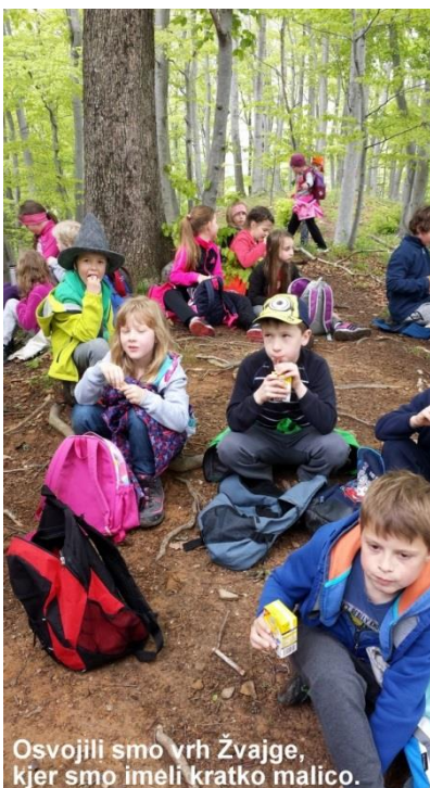
Osvojili smo vrh Žvajge, kjer smo imeli kratko malico.