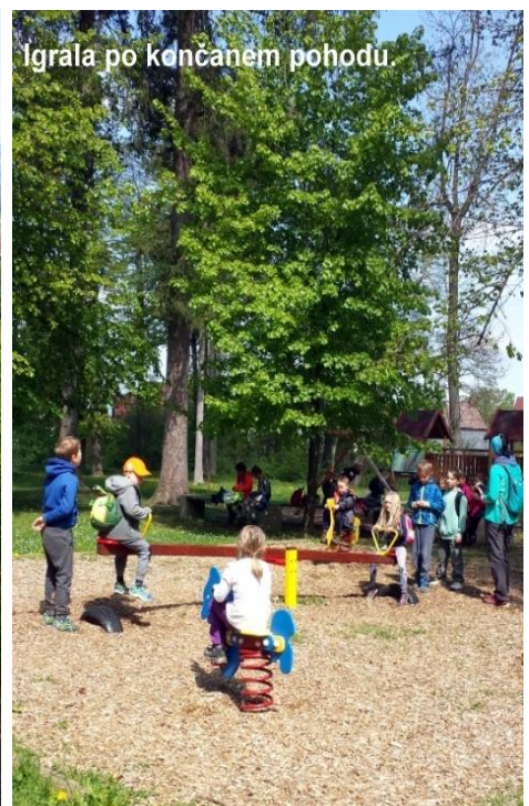
Igrala po končanem pohodu.